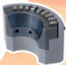
Boîtier porte-caractères spécial

Le mécanisme à percussion peut fonctionner dans toutes les positions ( marquage vers le haut : nous consulter ).